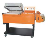
Колпаковая термоусадочная машина BSF-5540