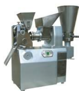
Пельменный аппарат JGT-60