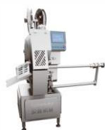
Автоматический клипсатор CSK-15II