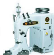
Мешкозашивочная голова GK-35-2C