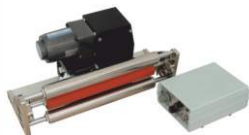
Встраиваемый датер на твердых чернилах MY-812-A