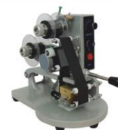
Ручной датер с термолентой DY-8