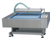
Автоматический конвейерный вакуумник HVB-1020F/2