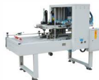
Автоматический заклейщик коробов JFX-5060