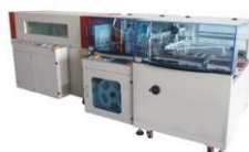
Высокоскоростная термоусадочная линия BSF-5545LD+BS-5030X