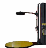
Автоматический паллетоупаковщик с прижимом HL-2100P