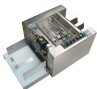
Автоматический датер на твердых чернилах MY-300A