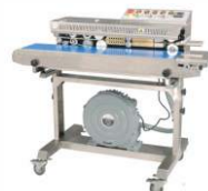
Конвейерный запайщик с откачкой воздуха FRMC-1010III