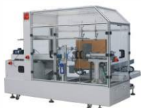
Автоматический сборщик коробов CXJ-6040C