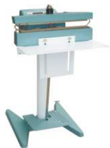
Напольный импульсный запайщик PFS