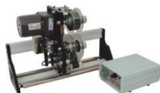
Встраиваемый датер с термолентой HP-241G