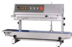
Конвейерный запайщик FRM-810II