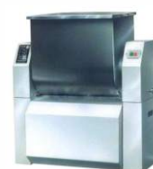
Фаршемесильный аппарат BWL-50