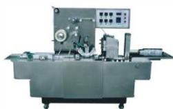
Автоматический целлофанатор TDP-420A