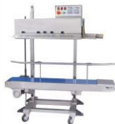
Конвейерный запайщик для тяжелых пакетов FR-1370LD