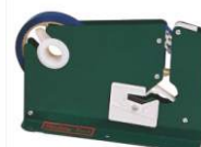
Ручной клипсатор TD-A