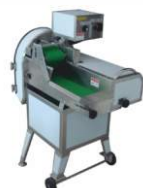
Порционирующая машина ATS-804