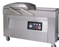
Двух-камерная вакуум-упаковочная машина DZ-510S/2A