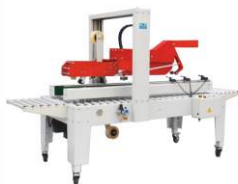
Автоматический заклейщик коробов FXJ-5050Z