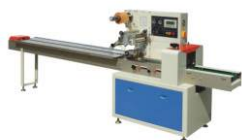
Горизонтальная упаковочная машина DXDZ-250B