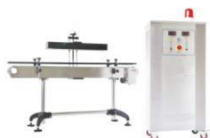
Автоматический индукционный запайщик HL-3000A