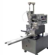
Хинкальный аппарат BGL-25