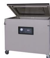
Напольная вакуум-упаковочная машина DZ-1100/2L