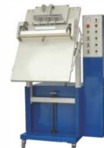
Безкамерная вакуум-упаковочная машина DZQ-600K