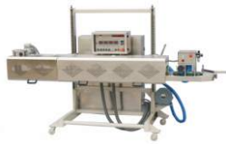
Конвейерный запайщик для тяжелых и особо плотных пакетов FBH-42D