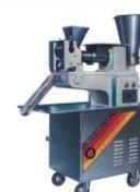
Пельменный аппарат JGL-120-5B