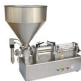
Поршневой дозатор PPF-500T