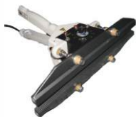
Ручной запайщик постоянного нагрева FKР