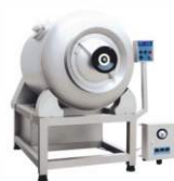
Вакуумный массажер GR-1000