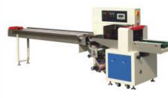
Горизонтальная упаковочная машина с нижней подачей пленки DXDZ-350X