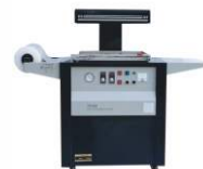
Скин-упаковочная машина TB-390