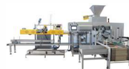
Фасовочно-упаковочная линия для мешков 20-50 кг ZSG-1000A