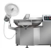
Невакуумный куттер ZB-80