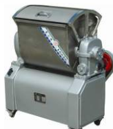
Тестомесильный аппарат HWJ