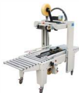
Пневматический заклейщик коробов FXJ-5050Q