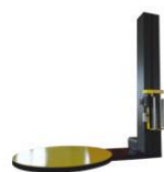
Автоматический паллетоупаковщик HL-2100