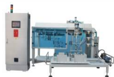
Упаковочная линия для мешков 20-50 кг ZSG-300B