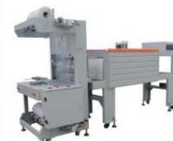
Полуавтоматическая линия для групповой упаковки BSF-6030X/BS-5540M