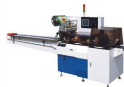
Горизонтальная упаковочная машина с сопровождающими губками DXDZ-450W