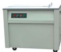
Полуавтоматическая стрейпинг-машина KZB-1