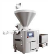
Вакуумный шприц ZKG-6500