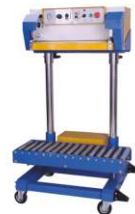
Пневматический запайщик QF