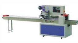
Горизонтальная упаковочная машина DXDZ-350B