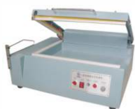
Ручной аппарат для запайки и отрезки BSF-501