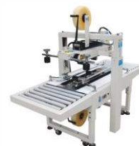
Полуавтоматический заклейщик FXJ-6050