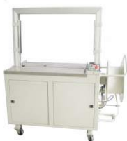
Автоматическая стрейпинг-машина KZ-8060/C