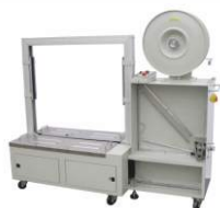
Автоматическая стрейпинг-машина KZD-8080/C