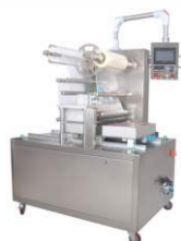
Автоматический запайщик лотков HVT-450F