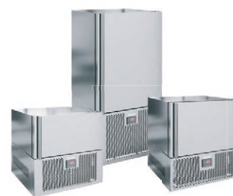
Удаление микроорганизмов под действием низких температур в шокерах POLAIR Grande