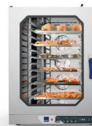
Приготовление или регенерация в пароконвектоматах RADAX