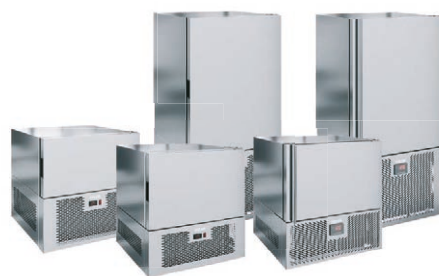
Быстрая заморозка в шокерах POLAIR