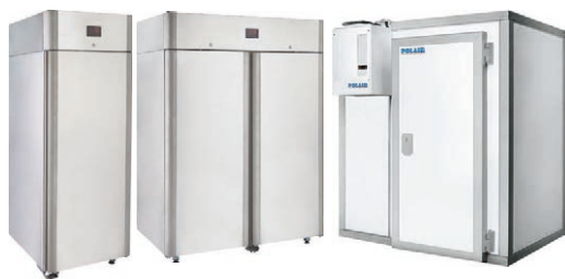
Хранение в СВ107 Gm/ СВ114 Gm или в КХН