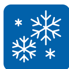
Заморозка в быстром режиме