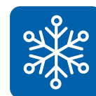
Охлаждение в мягком режиме