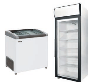
Демонстрация и продажа в морозильных шкафах и ларях POLAIR