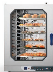
Приготовление или регенерация в пароконвектоматах RADAX