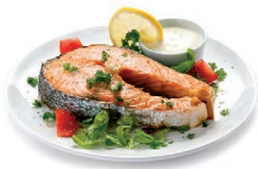
Свежие продукты, полуфабрикаты и готовые блюда