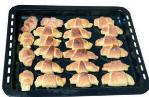
Полуфабрикаты и заготовки из теста