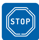
Завершение по времени или температуре