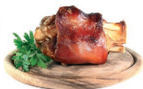
Полуфабрикаты и готовые блюда