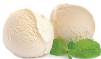
Полуфабрикаты мороженого после фрезерования смеси