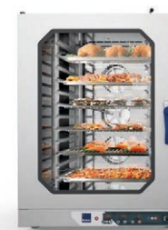
Приготовление в пароконвектоматах RADAX