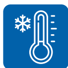
Температура в камере до -35^{\circ}\text{C}