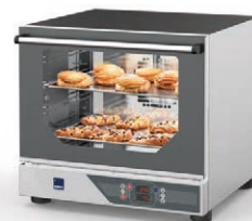
Выпечка в конвекционных печах RADAX