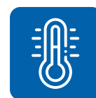
Температура окружающей среды до +40^{\circ}\text{C}